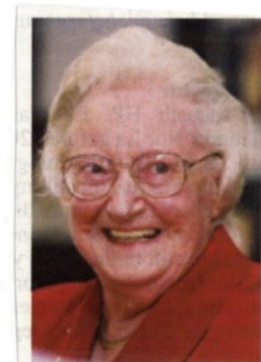
Dame Cicely Saunders

The suffering that encompasses all of a person`s physical, mental, social, spiritual pain and practical struggles.