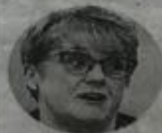
Kunnskapsminister Trine Skel Grande (V)

enkle rutiner som skolene skal følge, sier Skel Grande.